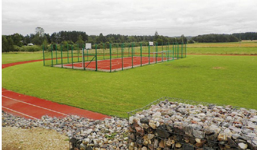
Ābeļu pamatskolas stadions.