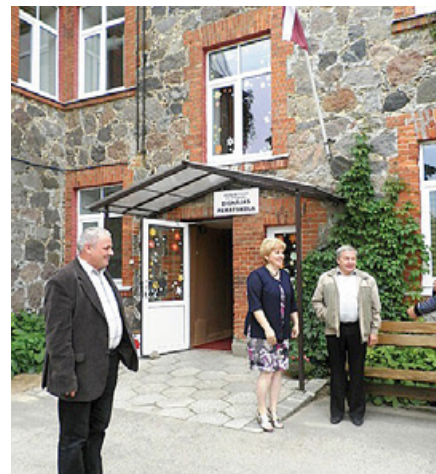
Pie Dignājas pamatskolas.